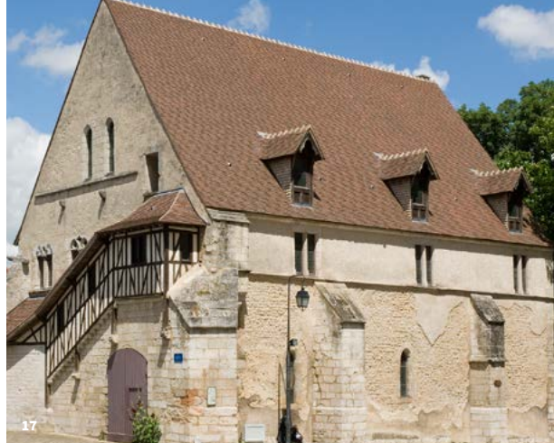
17. La grange des dîmes