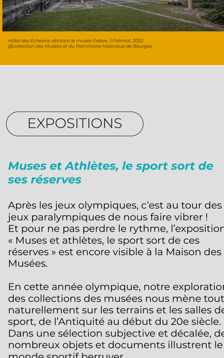
Hôtel des Echevins abritant le musée Estève, J. Frémiot, 2022 ©collection des Musées et du Patrimoine historique de Bourges

>RDV au musée Estève, rue Edouard-Branly >Gratuit