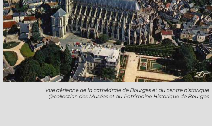
Vue aérienne de la cathédrale de Bourges et du centre historique

Rendez-vous à l'Office de Tourisme. RÉSERVATIONS OBLIGATOIRES à l'Office de tourisme ou au 02.48.23.02.60 ou via www.bourgesberrytourisme.com Pas de vente de billet au départ.