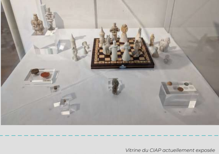
Vitrine du CIAP actuellement exposée

« Aléas ludiques » Jusqu'au 23 septembre 2024