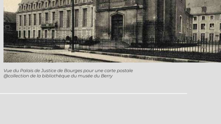
Vue du Palais de Justice de Bourges pour une carte postale

5 sur inscription obligatoire avant le 9 septembre : 02.48.57.81.46 ou par mail à patrimoine@ville-bourges.fr