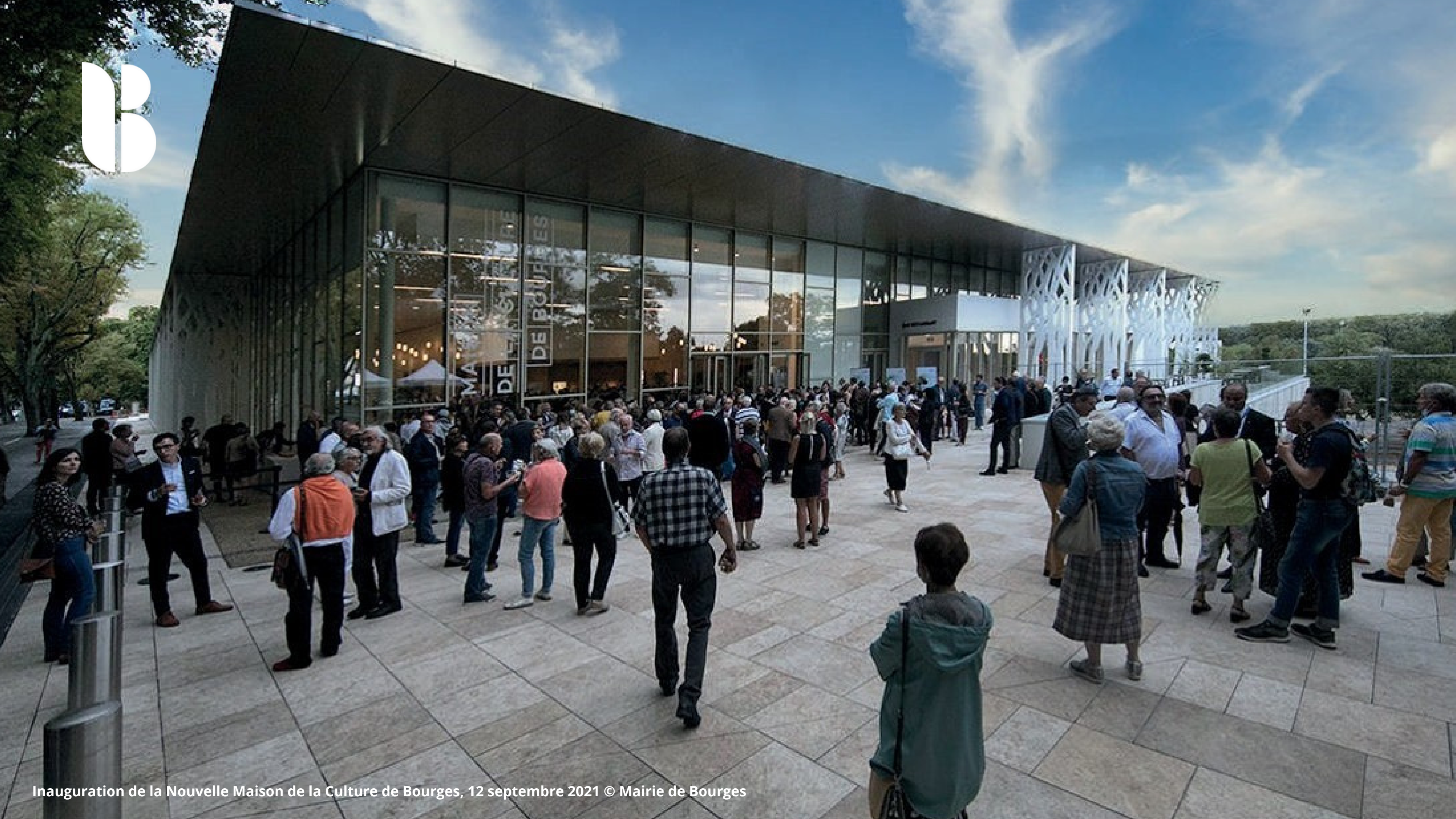
Inauguration de la Nouvelle Maison de la Culture de Bourges, 12 septembre 2021