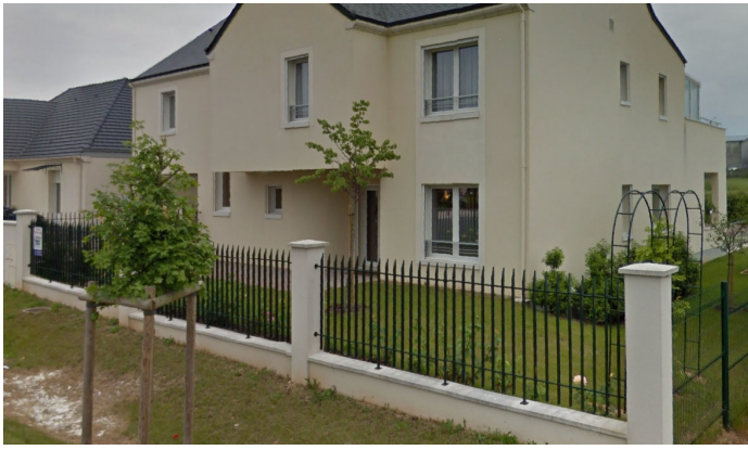
Exemple de clôture surmontée d'une partie ajourée