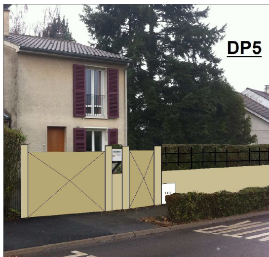
Exemple d'insertion de projet dans l'environnement